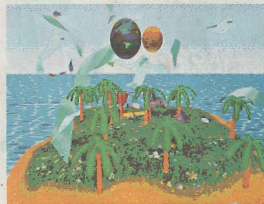
利用軀體畫筆的虛擬空間的「智慧情境治療系統」(SAT) 裏的理想世界。