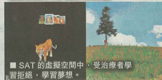
SAT 的虛擬空間中，受治療者學習拒絕，學習夢想。