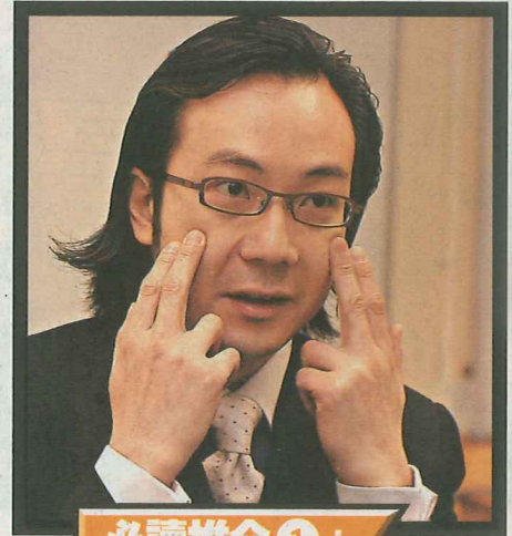
◀ Desmond說，談話時，可望着對方的眉心或額骨，不要眼定定望着對方雙眼。

猴年將盡，捱過雙糧、花紅後， 又是打工仔轉工的活躍期，撫心自問過去一年， 你有否把握增值機會，增加轉工或加人工的籌碼？ 若果沒有，雞年便要好好進修一下， 提升個人競爭力，為未來事業前途鋪路。 今期《青雲路》推介三個「'05 big hit增值課程」， 包括：商務禮儀、人力資源學和音樂治療課程， 想搵工跳槽快人一步，即睇！