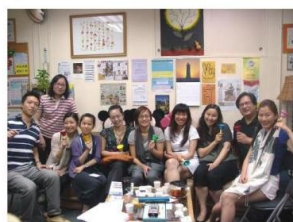
一眾創意藝術治療師在本中心聚會，分享工作心得。

在未來的日子裡，本中心將繼續與不同的機構合作，提供優質的音樂治療服務，並積極為熱愛音樂治療的機構與同工提供多元化的培訓課程，好讓音樂治療的聲音響遍香港與華人的社區。