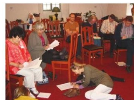
Participants Writing Feedback