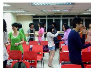
伍 Sir 為工聯會主持音樂治療基礎工作坊，參加者愉快地體驗音樂治療活動。