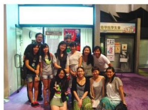
演藝進修學院新一屆音樂治療活動籌備畢業學員。