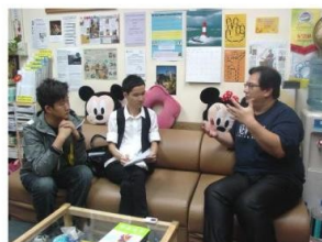
伍 Sir 接受香港教育學院宗教教育與心靈教育中心訪問。