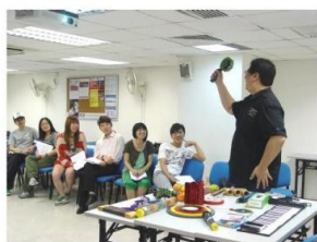
伍 Sir 到澳門商業管理教育中心向學員介紹音樂治療。