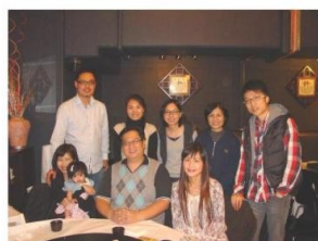
伍 Sir 與墨爾本大學音樂治療學生及畢業生合照。