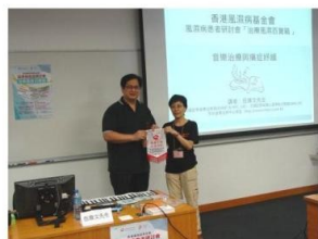
伍 Sir 為香港風濕病基金會風濕病患者研討會講解音樂治療與痛症舒緩。