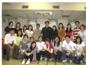
香港聖公會一群社工完成了 18 小時的長者音樂治療培訓，相信他們能更自信地帶領音樂活動。