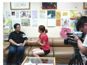
伍 Sir 接受健康衛視訪問，介紹專業音樂治療中心的服務與活動。