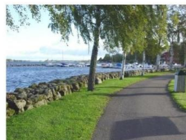
The Beautiful Scene of Vadstena