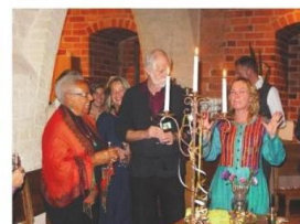
Participants Celebrating after the Ceremony