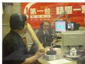
伍 Sir 接受香港電台第一台「精靈一點」訪問，向聽眾介紹音樂治療對病人舒緩情緒的方法。