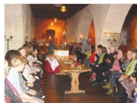
New Fellow Ceremony